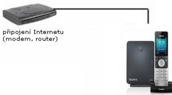
připojení Internetu (modem, router)

V balíčku naleznete ethernetový kabel. Vezměte jej a propojte základnu Yealink a zařízením k internetu (modem, router, switch). Jeden konektor zasuňte do zdířky zařízení k internetu a druhý konektor kabelu zasuňte do zdířky na základně IP telefonu. Základnu připojte napájecím kabelem do elektrické sítě. V případě, že Vám poskytovatel internetu přiděluje veřejnou IP adresu je nutné před telefonní zařízení zapojit router.