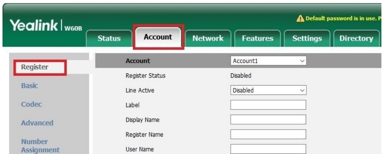
(obrázek č. 5)

Po přihlášení se přesuňte na záložku „ Account/Účet “ a zde vyberte „ Register/Registrace “ (viz obrázek č. 5).