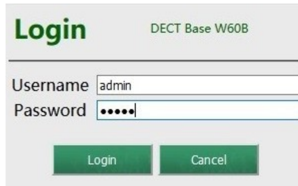
(obrázek č. 4)

Po zadání IP adresy do prohlížeče, se Vám zobrazí přihlašovací stránka (viz obrázek č. 4). Zde do prázdného políčka Username zadejte přihlašovací jméno a do Password heslo (defaultně je od výrobce přednastaveno jméno admin a heslo admin ) poté stiskněte tlačítko Login/Přihlášení . Doporučujeme do zařízení nastavit svoje vlastní heslo a lépe jej tak chránit před možným útokem